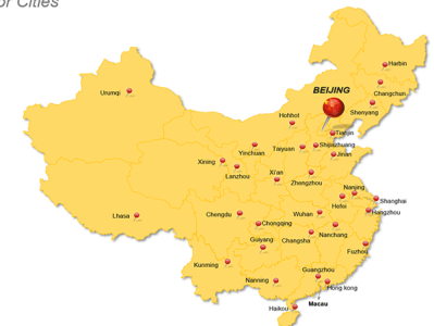
China Major Cities